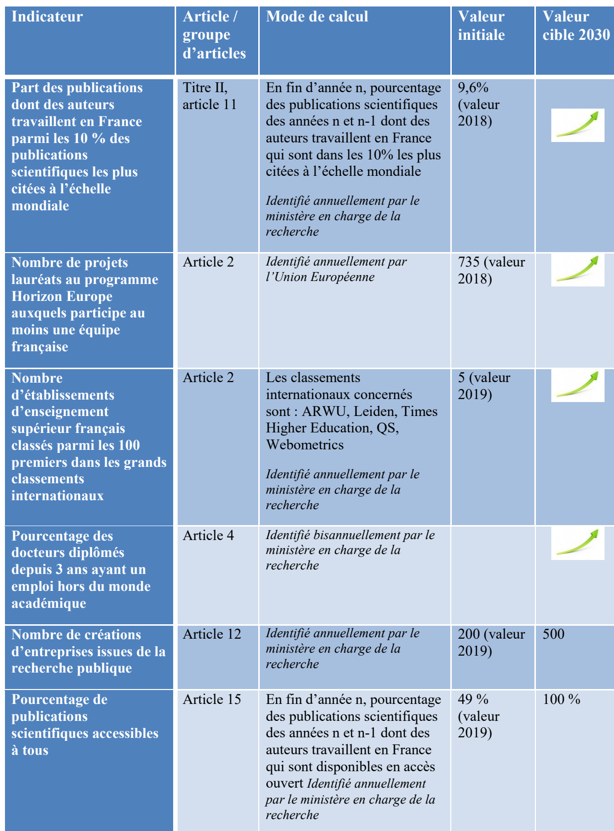
Tableau des indicateurs d'impact